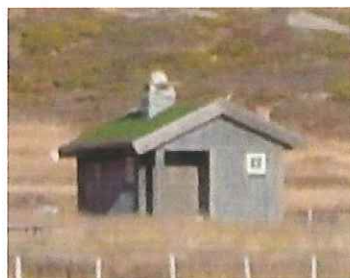
Bilde av uthus i 2015