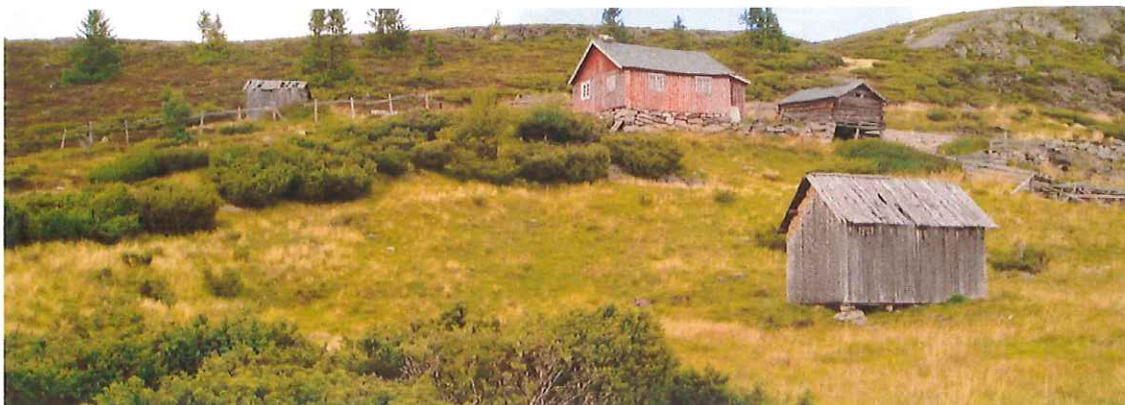
Støl til Prestrud 43/3 slik det så ut i 2003.

Under stølsregistreringen i 2000 ble bebyggelsen på stølen målt til følgende areal: