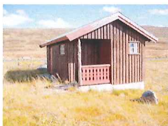
Bilde av uthus i 2003