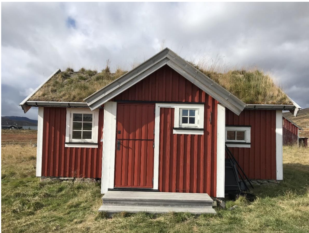
Selet sett fra øst.