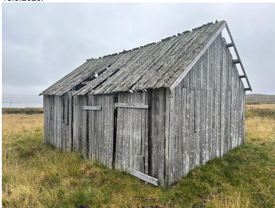
Gammel løe ved Urek. Foto frå september 2023.

Søknaden er sendt videre til Borghild Simengård i Statskog og til Innlandet Fylkeskommune 18.8.2023.