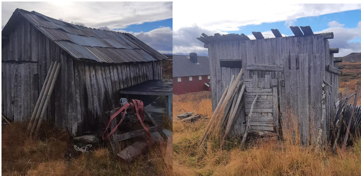
Gammelt naust f. 713 og gammel utedo/grisehus f. 596.