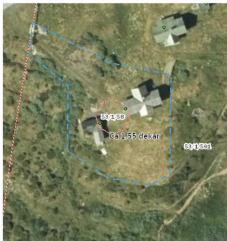
Fnr 58, fritidsbolig, ta ut ca 1,55 dekar