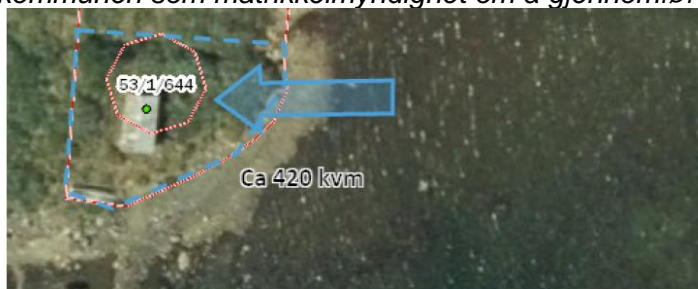
Fnr 644, naust, ta ut ca 420 m 2 fra stølsjordet.

Konkret forslag er vedlagt, og vi ber om uttale om dette kan aksepteres. Vi vil deretter varsle kommunen som matrikkelmyndighet om å gjennomføre en grensejustering på fnr 951.»