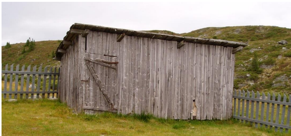
Bilde av eksisterende uthus (fra stølsregistrering i 2003).