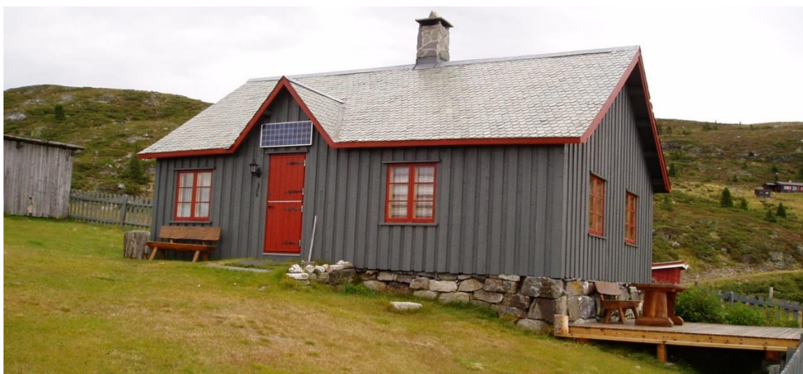
Selet med uthuset i bakgrunnen.