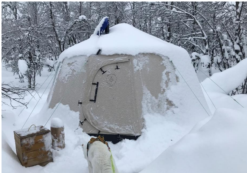
Teltcampen ved Kvitfeten 2020/21

I e-post 24.8.2021 ber Statskog om Fjellstyrets uttale i henhold til fjelloven § 12.