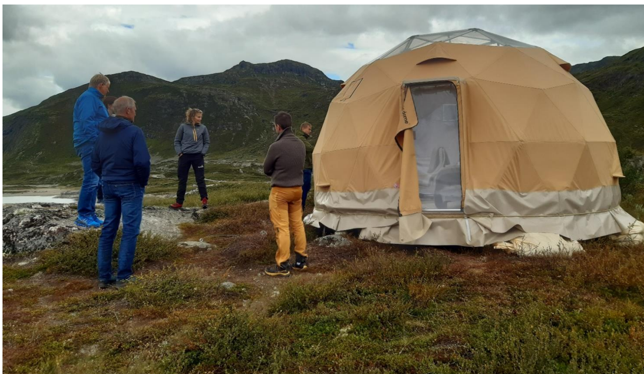
Bilde viser tilsvarende «Dome» ved Bygdin.