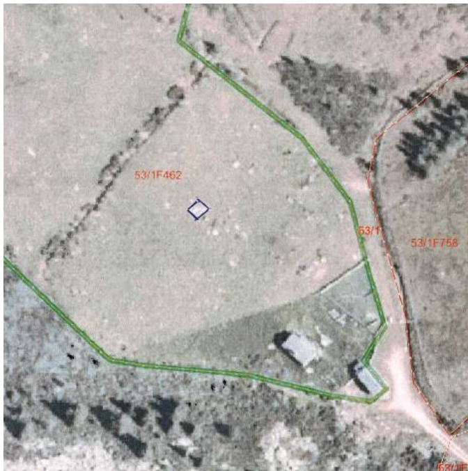
Plassering av høyløe.