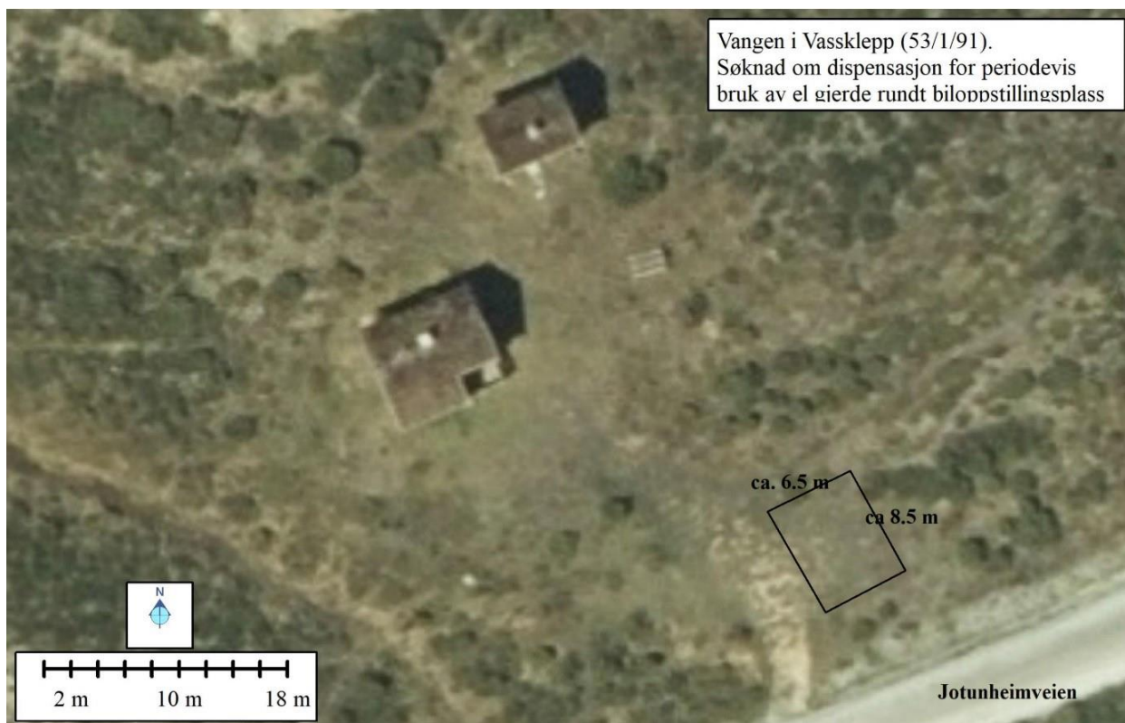
Fig. 2 Omsøkt løsning med periodevis elektrisk gjerde evt. modulbasert stakittgjerde rundt bilparkering.

Skader og ulemper nevnt i kulepunkt 1-4 kan forebygges og utbedres med egeninnsats uten store økonomiske uttelling. Dette gjelder også økt vedlikehold pga. 'kløskader' på bygninger og rasteutstyr. Skader på parkerte biler kan imidlertid fort komme opp i sekscifra beløp, og det er naturlig nok spesielt ille når skader oppstår på besøkende sine biler. Fjellbeitene er generelt saltfattige, og i høyfjellet er det også mangel på naturlige 'kløobjekter'. Dette er noe av forklaringen på at vegsøle med vegsalt på biler og bygninger/rasteutstyr er attraktive henholdsvis som saltkilde og 'kløobjekter'.