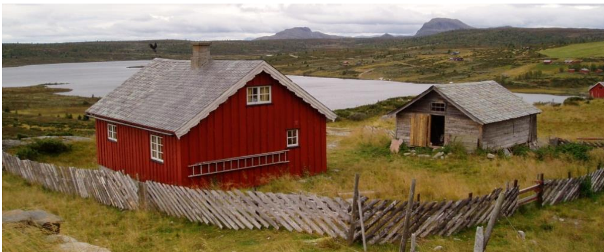
Dagens bebyggelse på stølstunet.